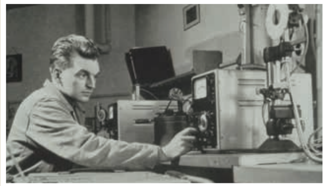
Forschender Assistent vor elektrischen Messgeräten im Institut für Werkzeugmaschinen, 1959.

Eine eigene Universitätsstiftung stärkt und fördert die TUM auf dem Weg zu einer weltweit anerkannten Eliteuniversität. Aus diesem Grund habe ich mich bei der Gründung finanziell engagiert.