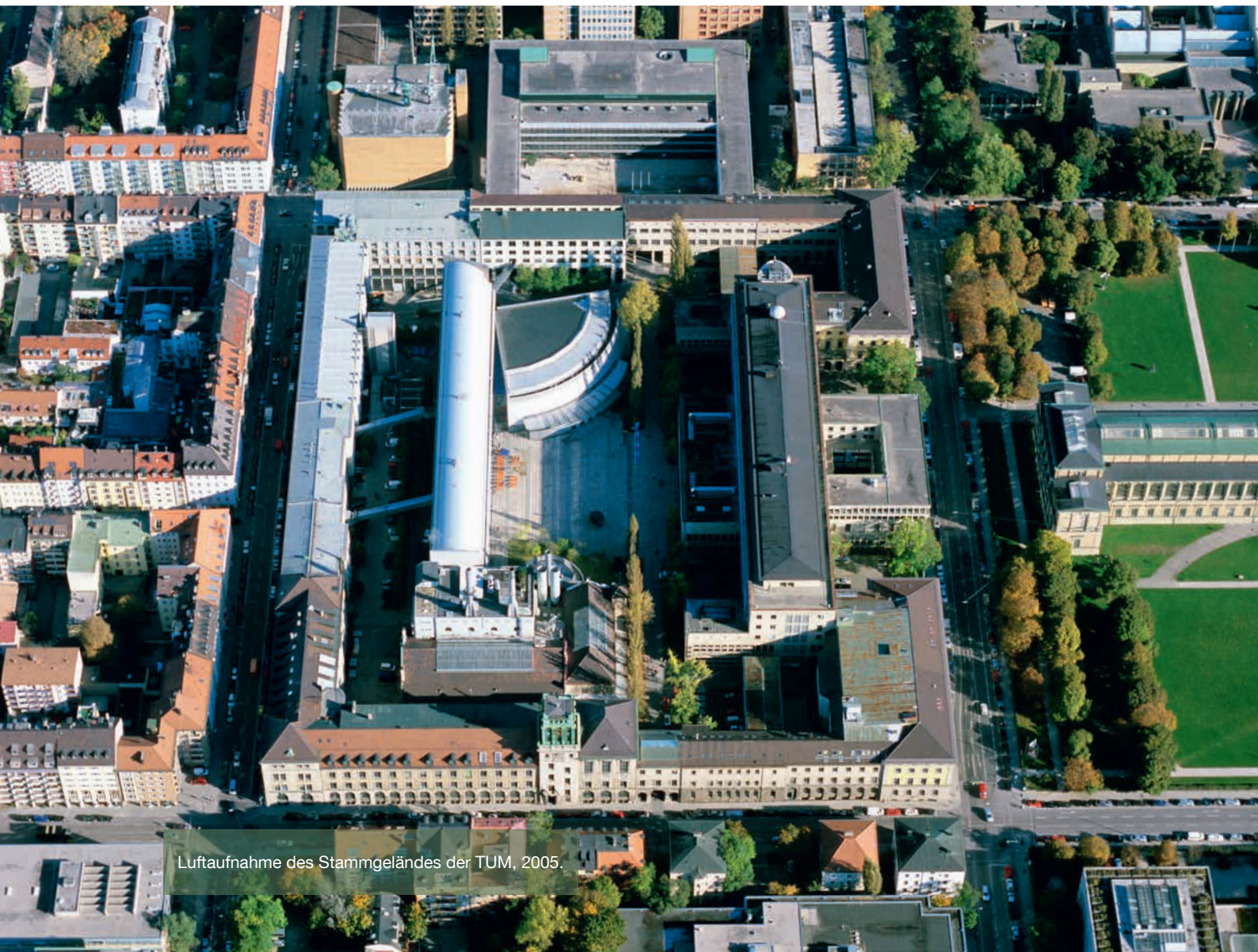
Luftaufnahme des Stammgeländes der TUM, 2005.