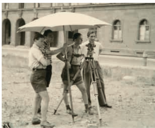
Geodäsie-Übung auf dem Ruinengrundstück vor dem weitgehend erhalten gebliebenen südlichen Bestelmeyer-Bau, 1950.