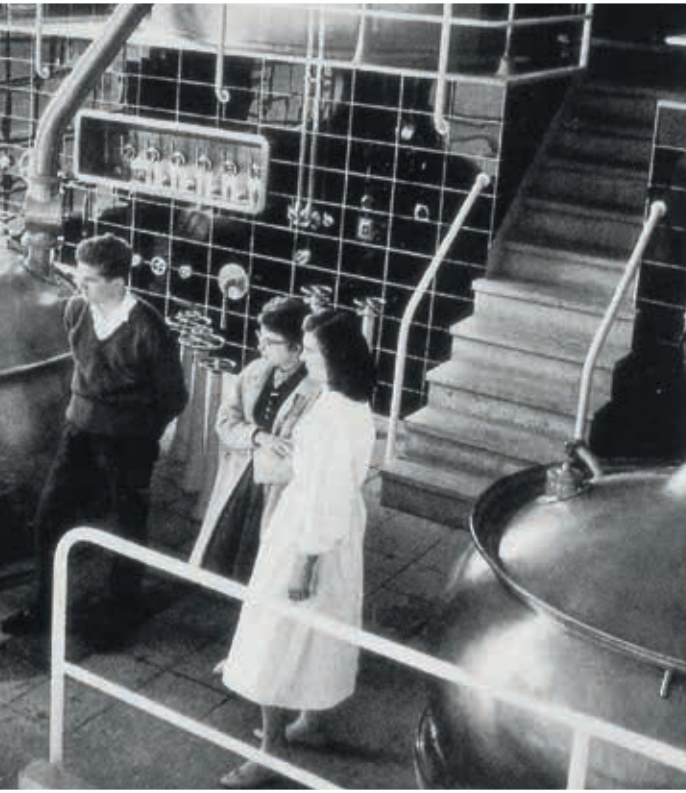
Im Sudhaus der Lehr- und Versuchsbrauerei Weihenstephan, 1959. Noch bis in die 1960er Jahre studierten pro Jahr höchstens eine oder zwei Frauen das Brauereifach.