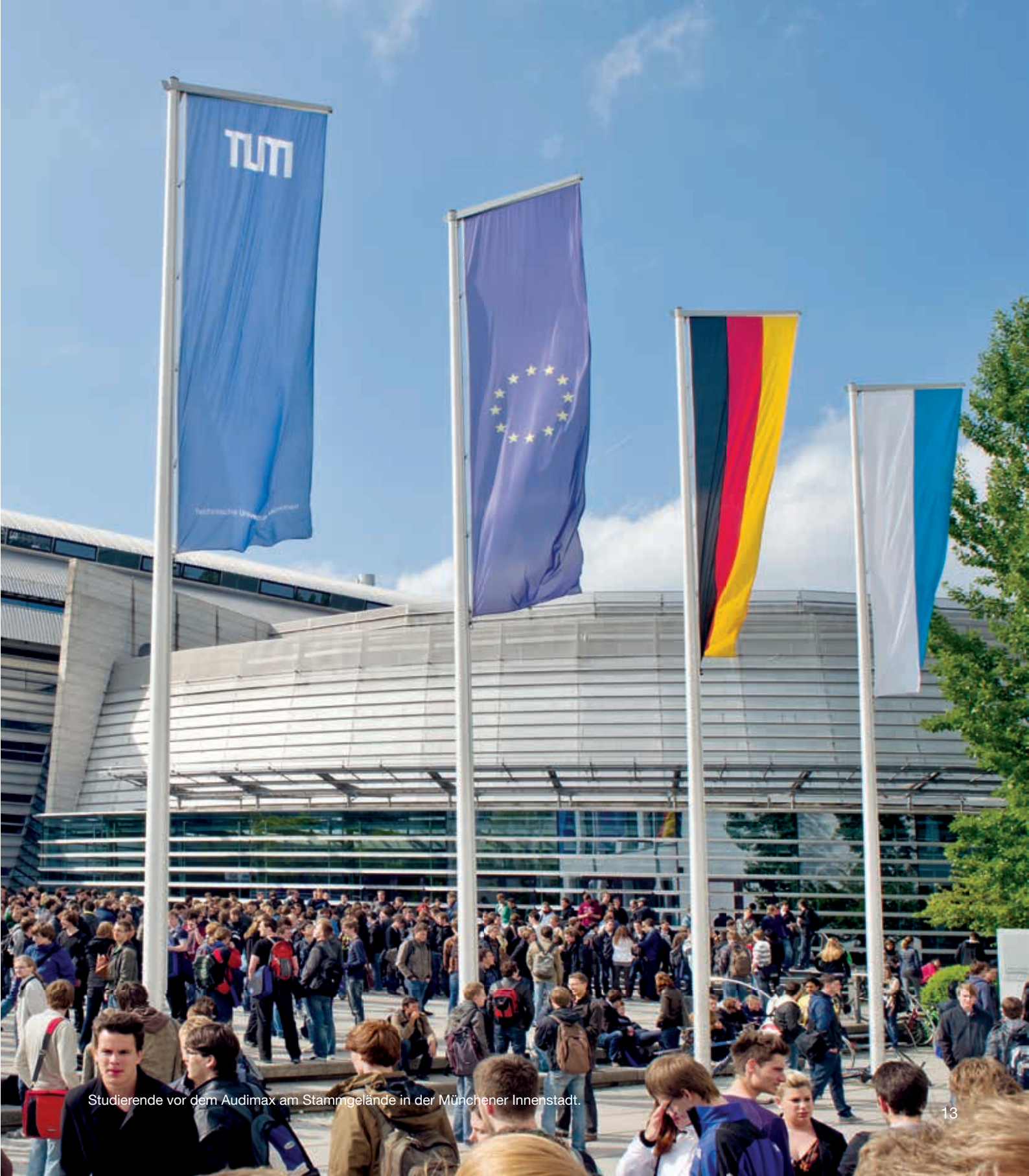
Studierende vor dem Audimax am Stammgelände in der Münchener Innenstadt.