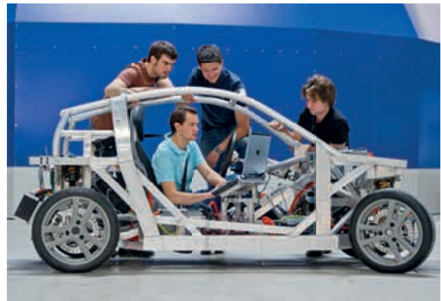
Studenten tüfteln am TUM-Elektroauto MUTE.

In nationalen und internationalen Rankings belegt die TUM regelmäßig Spitzenplätze. So schaffte sie es im Shanghai-Ranking 2011 als einzige deutsche Universität unter die Top50. In beiden Runden der Exzellenzinitiative 2006 und 2012 wurde sie als Exzellenzuniversität ausgezeichnet. Bereits in der ersten Förderperiode 2006-2011 konnte sie neue Wege im internationalen Wettbewerb erschließen. Mit dem TUM Institute for Advanced Study ist ein renommier-tes Zentrum für die wissenschaftliche Elite entstan-