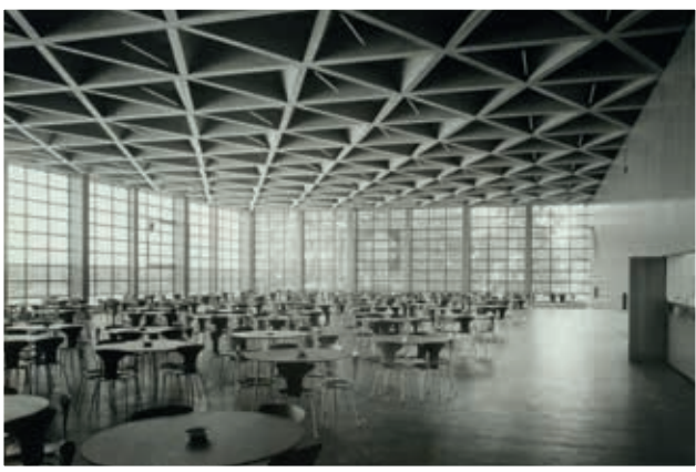
Großer Speisesaal der Mensa an der Arcisstraße, 1959.