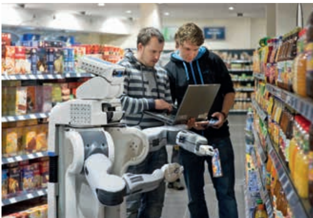
Robotikforschung für den Alltag: Testfall Supermarkt.

Bildung ist im globalen Wettbewerb die Schlüsselressource für unser rohstoffarmes Land. Mit einer qualitativollen Ausbildung trägt die TUM dazu bei,