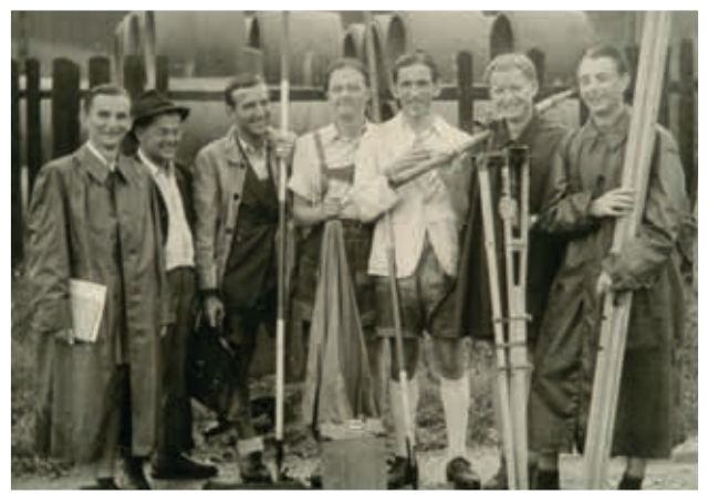
Künftige Bauingenieure auf Exkursion, 1950.