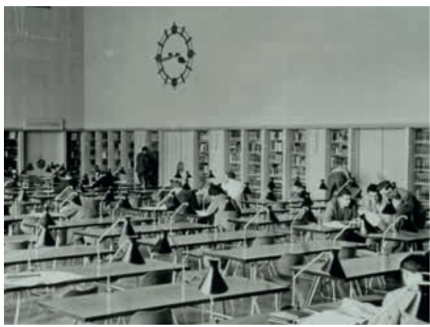
Der Lesesaal der THM-Bibliothek im Jahr 1956.

Gerne unterstütze ich meine Alma Mater, weil ich meinen Physik-Studien an der TUM manches zu verdanken habe, weil ich stolz auf unsere Exzellenzuniversität bin und weil ich möchte, dass sie auch künftig an der Spitze bleibt und den Standort Bayern stärkt.