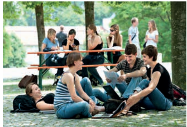
Relaxen im Biergarten am Campus Weihenstephan.