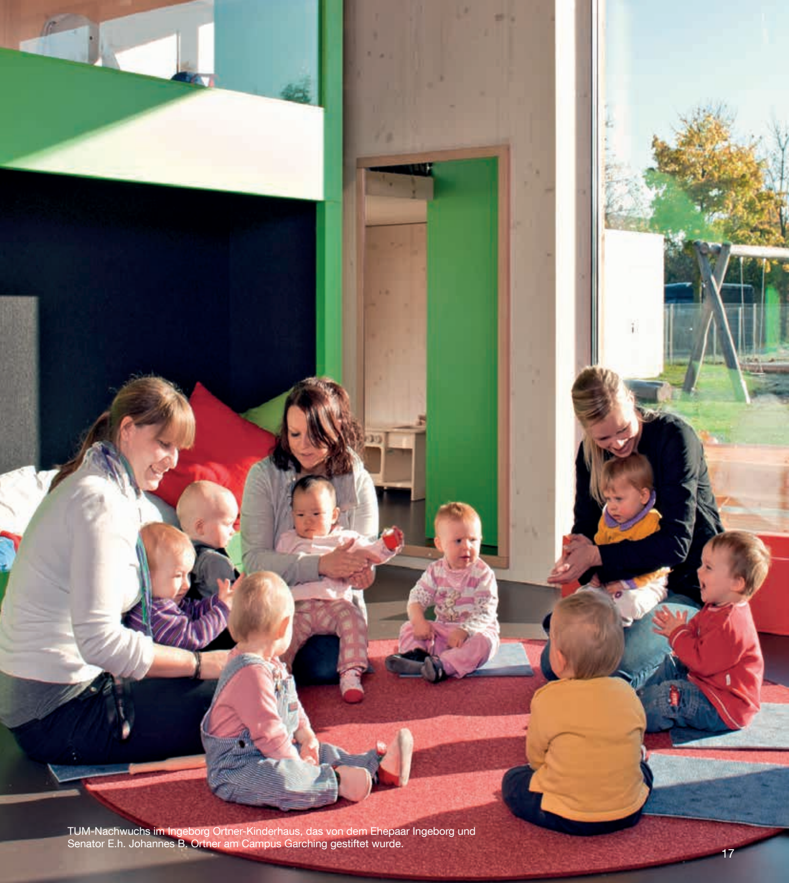
TUM-Nachwuchs im Ingeborg Ortner-Kinderhaus, das von dem Ehepaar Ingeborg und Senator E.h. Johannes B. Ortner am Campus Garching gestiftet wurde.