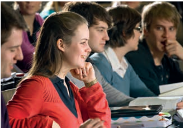
Ein Drittel aller Studierenden der TUM ist weiblich.

Diese Dynamik darf nichts von ihrer Kraft verlieren. Deshalb hat die TUM 2010 die TUM Universitätsstiftung gegründet, um die Finanzierungsbasis zu verbreitern und von staatlichen Budgets unabhängiger zu werden. Stiftungszweck ist u. a. die Förderung von Forschungsprojekten, Stiftungsprofessuren, Gastdozentenprogrammen, Stipendien, Veranstaltungen, Preisen, Netzwerk- und Alumni-Arbeit sowie sozialen Projekten. Die Stiftungsgremien - Stiftungsvorstand, Stiftungsrat, Universitätsausschuss und Stifterkonferenz - sorgen dafür, dass die Erträge des Stiftungskapitals sinnvoll für die Entwicklung der Hochschule und zum Wohle der künftigen Generationen eingesetzt werden.