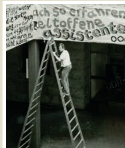
Studentenprotest im Sommer 1969. Studierende beklagen u. a. „bloßes Faktenpauken“ und Bevormundung durch Professoren während des Studiums.