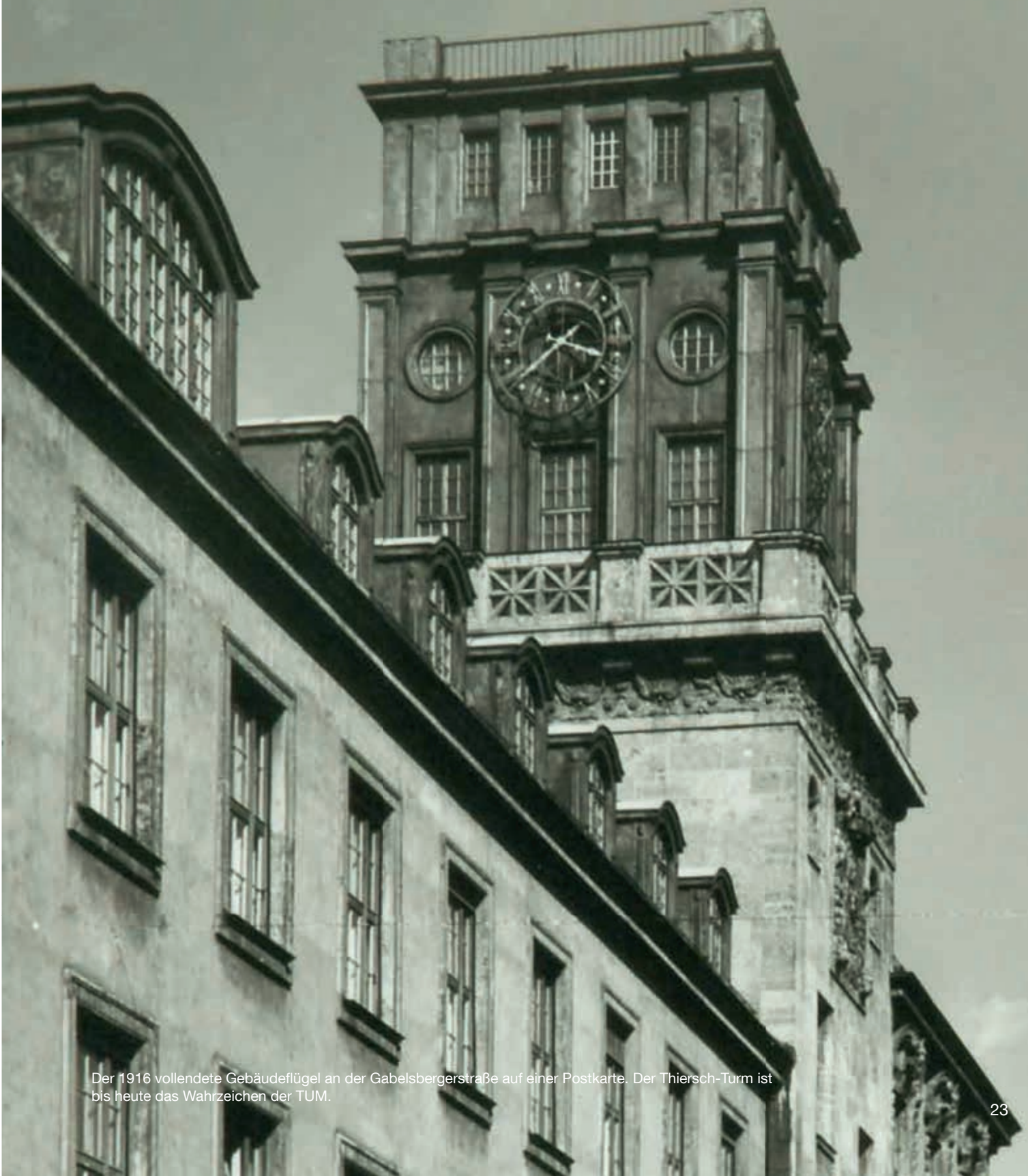
Der 1916 vollendete Gebäudeflügel an der Gabelsbergerstraße auf einer Postkarte. Der Thiersch-Turm ist bis heute das Wahrzeichen der TUM.